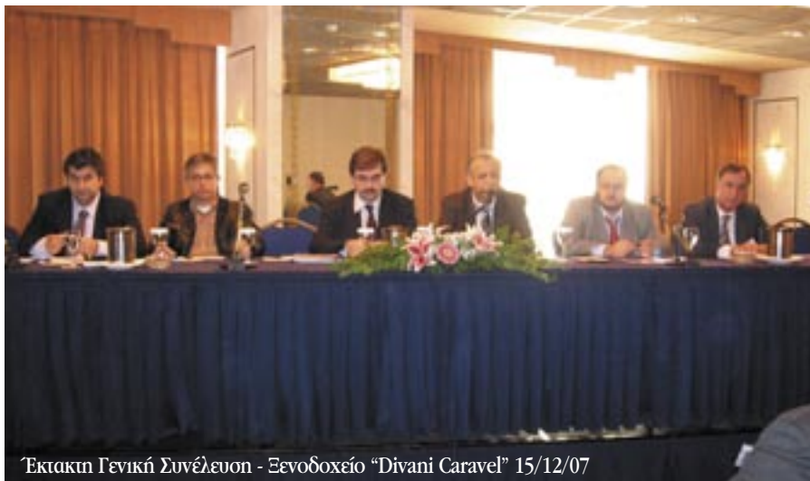
Έκτακτη Γενική Συνέλευση - Ξενοδοχείο “Divani Caravel” 15/12/07