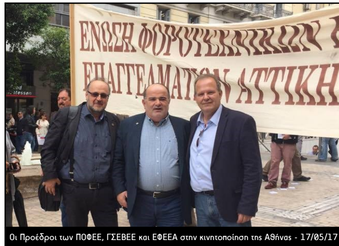
Οι Πρόεδροι των ΠΟΦΕΕ, ΓΣΕΒΕΕ και ΕΦΕΕΑ στην κινητοποίηση της Αθήνας - 17/05/17

Η μεγάλη ανάγκη να υπάρξουν συνολικές οδηγίες και να ξεκαθα-