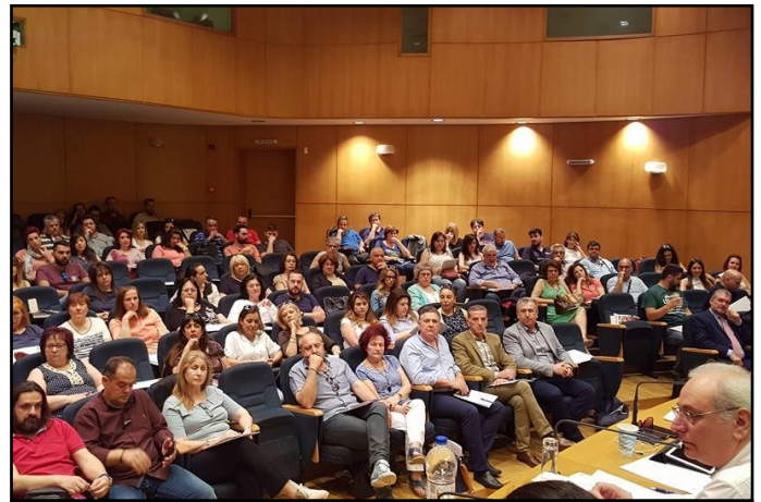
Φορολογικό Πανόραμα - Ηράκλειο Κρήτης - 13/05/2017

Ειδικά για το ζήτημα των κόκκινων δανείων και της ρύθμισης χρεών παρευρέθηκε και έκανε σχετική παρουσίαση ο Ειδικός