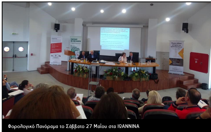
Φορολογικό Πανόραμα το Σάββατο 27 Μαΐου στα ΙΩΑΝΝΙΝΑ

Το Φορολογικό Πανόραμα των Ιωαννίνων διοργανώθηκε σε συνεργασία με την Ένωση Φοροτεχνικών Ελευθέρων Επαγγελματιών